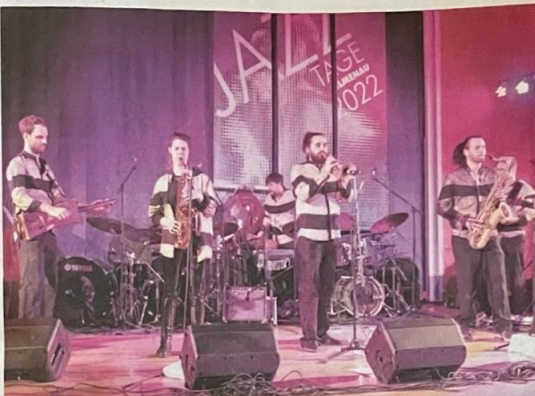
Mit ihrem seit langem hier erwarteten Konzert setzte „Shake Stew“ gegen Mitternacht einen fulminanten Schlusspunkt der 47. Jazztage.