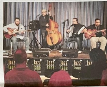
Beim Jazzbrunch im SFZ sorgte das „The Franz Ensemble“ aus München mit wunderbar konzertanter Musik für wohlthuende Gemütlichkeit.

Weitere Fotos finden Sie unter: www.insuedthueringen.de