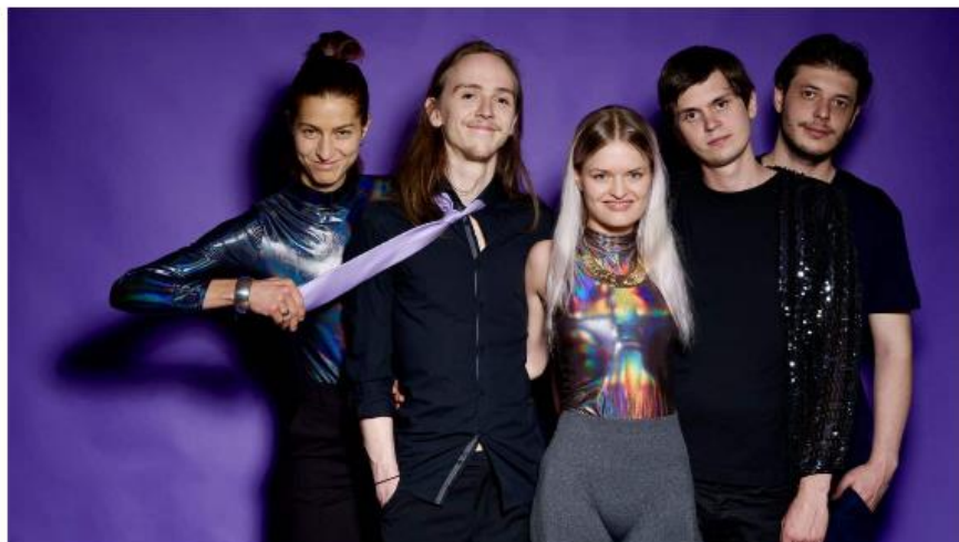
5 x 5